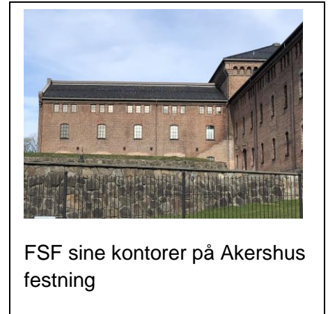
FSF sine kontorer på Akershus festning

Med de beste ønsker om en fortsatt god vår fra forbundskontoret