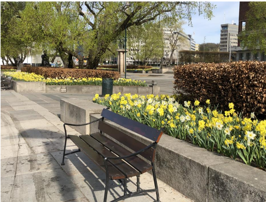
Vårblomster på Rådhusplassen i Oslo.

Dette er noe vi ønsker dere skal bidra med i tillegg til at dere sender oss artikler og bilder fra aktiviteter og turer dere gjennomfører når situasjonen er normal.