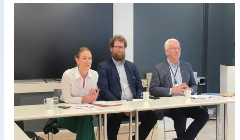
Fra møtet med Regjeringen