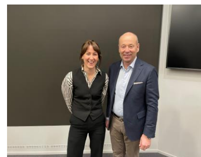
Statsbudsjettet 2025, innspill av FSFs krav