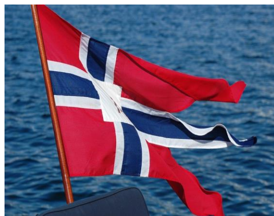
En maritim hilsen til 17. mai 2020