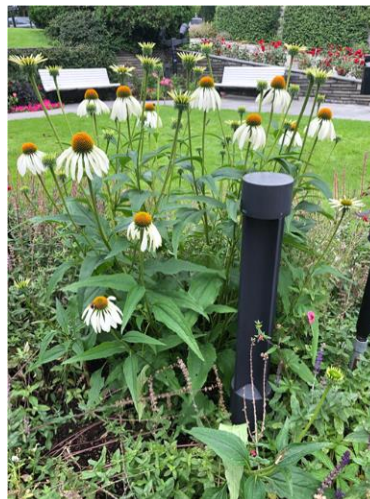
Sommeren er ikke helt forbi ...

I tillegg er det viktig at avdelingene gjennomføre arrangementer som kan avholdes innen myndighetenes pålagte smittevernregler.