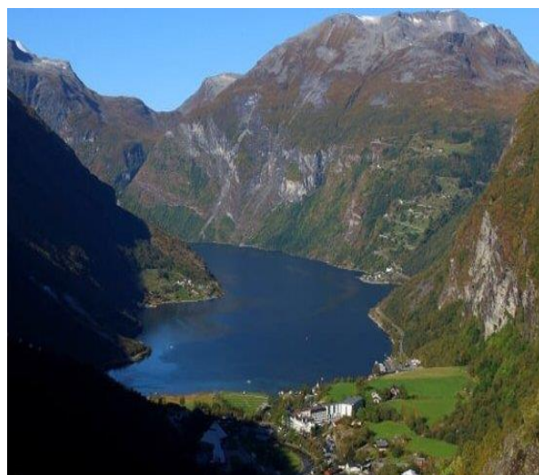
Geiranger uten turistskip