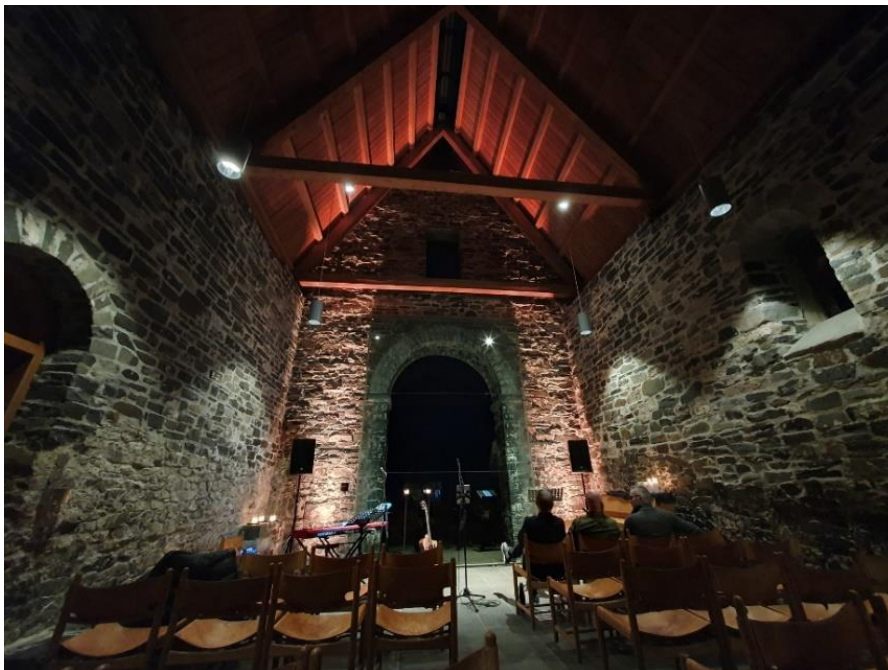
Et stemningsfullt kirkerom