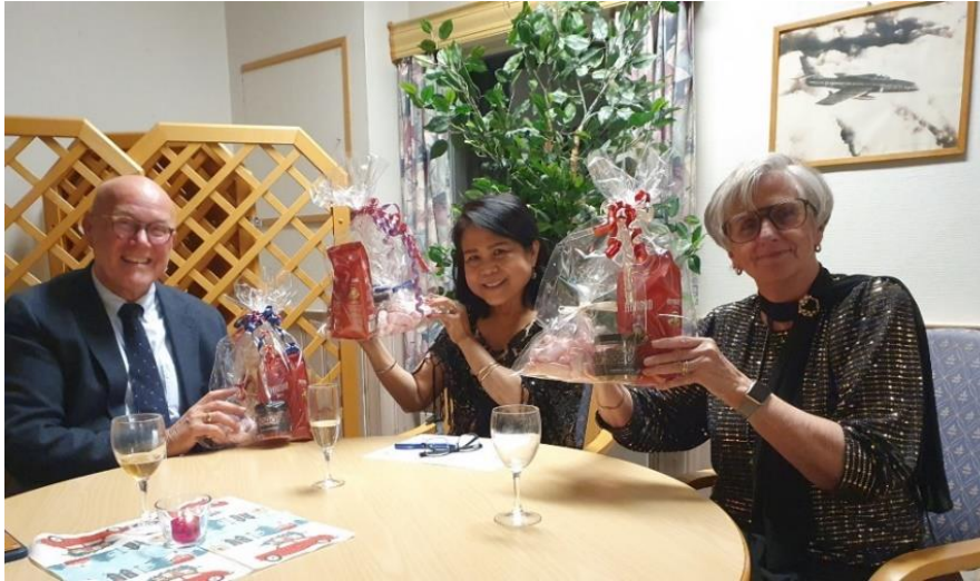
De glade vinnerne av årets jule-quiz