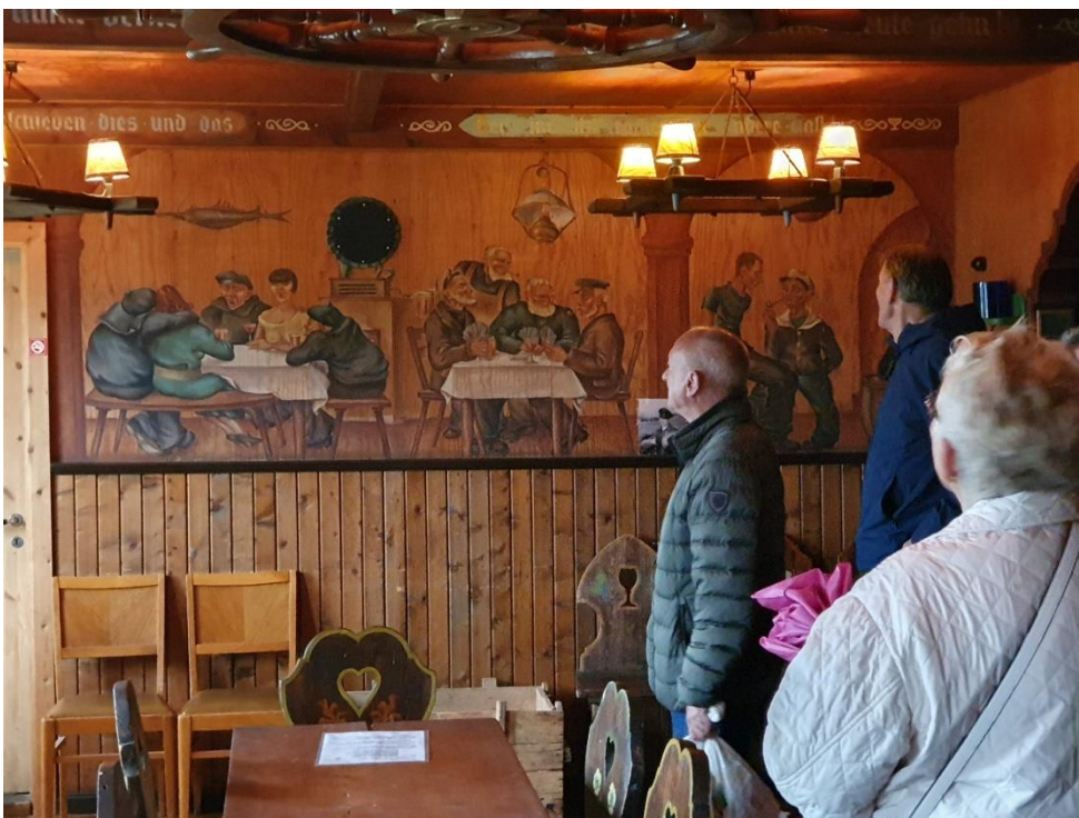
Messebygget på Nordberg fort med sine veggmalerier