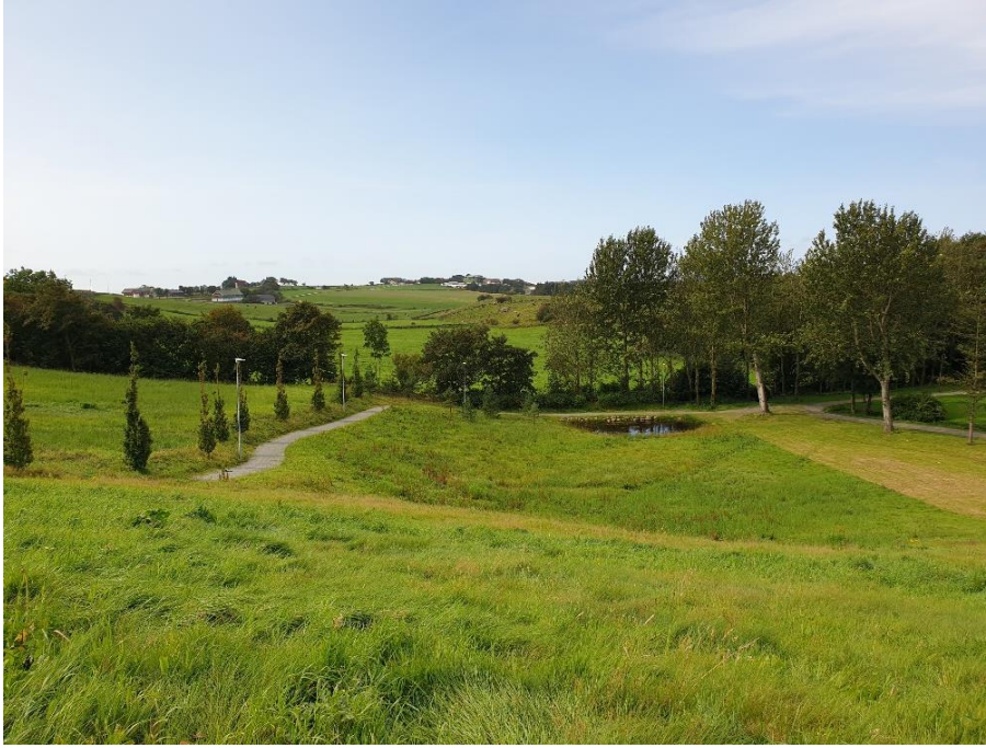
Kleppeloen i Solskinn

Vi tar en rolig rusletur i det fine området i Kleppeloen på Klepp og avslutter med et måltid på Edeståvå.